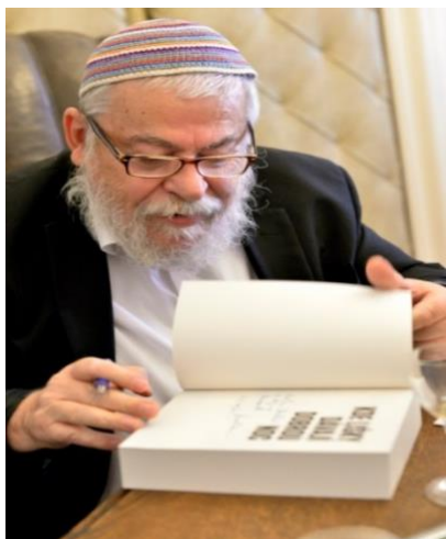
Karol Sidon, vrchní zemský rabín, dramatik, spisovatel, bývalý chartista a disident (*9. 8. 1942)

V oboru dirigování byl žákem Karla Ančerla, Václava Smetáčka a Václava Neumanna na Hudební fakultě Akademie múzických umění v Praze. V mládí studoval hru na klavír, trombón a violoncello. V době gymnaziálních studií začal hrát jako trombonista ve svém vlastním jazzovém Orchestru Libora Peška. V roce 1958 založil Komorní harmonii a v letech 1965 – 1969 komorní soubor Sebastian orchestr. Od roku 1970 hostoval u různých českých i zahraničních orchestrů. Byl přizván ke spolupráci s orchestry v Holandsku a krátce působil jako šéf Slovenské filharmonie v Bratislavě. V letech 1981 – 1990 byl stálým hostem České filharmonie. Vrcholem kariéry je jeho desetileté (1987 – 1997) působení ve funkci uměleckého ředitele a šéfdirigenta Královského filharmonického orchestru v Liverpoolu, se kterým dodnes vystupuje jako čestný dirigent. V Anglii se významně zasloužil o systematickou propagaci české tvorby, zvláště díla Josefa Suka. Od roku 1990 byl hlavním hostujícím dirigentem Symfonického orchestru hlavního města Prahy FOK. Nyní zastává post hlavního dirigenta Českého národního symfonického orchestru. Obdržel Řád britského impéria a získal prestižní Cenu Classic a z rukou prezidenta Václava Havla Medaili Za zásluhy I. stupně.